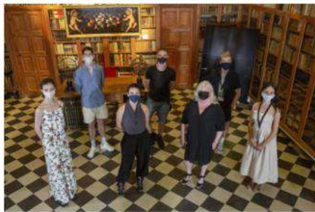
El Festival de Peralada (Girona) homenajea a Carmen Mateu en la gala 'Ballet under the stars'.

El Festival Castell de Peralada (Girona) rinde homenaje a la promotora cultural Carmen Mateu, fundadora del festival y fallecida en 2018, en la gala 'Ballet under the stars', que se celebrará este viernes.